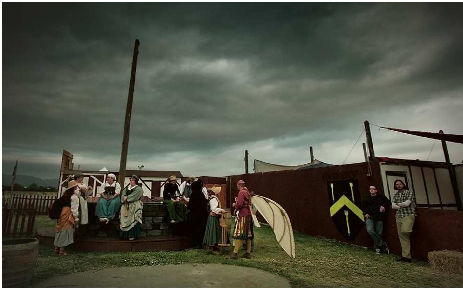
Renaissance fair, CA, 2009