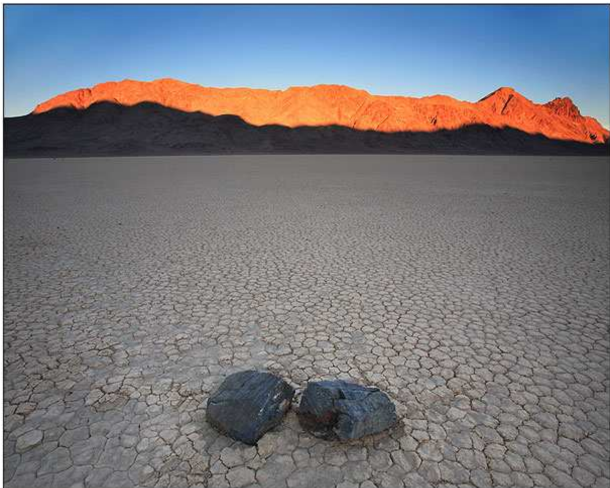
Yongjin E. Xie Photography 2007